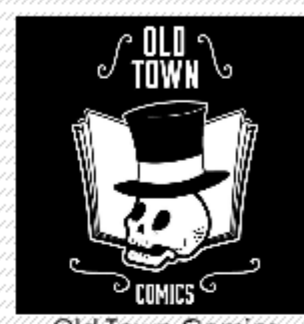
Old Town Comics