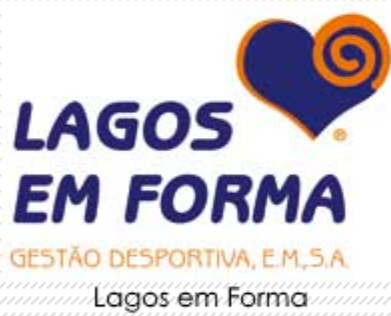
Lagos em Forma