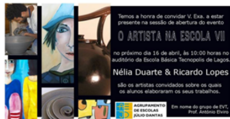
Dia 16: "Artista na Escola"

De 26 a 30 – Feira do Livro na Escola do Bairro Operário;