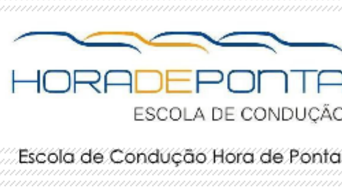
Escola de Condução Hora de Ponta