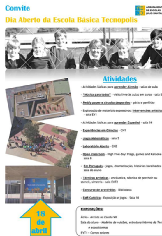
Dia 18: Dia aberto da Tecnopolis