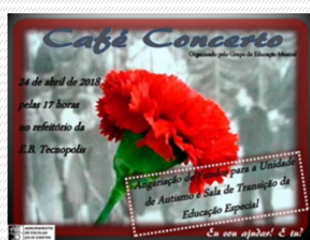
Dia 24: Café Concerto