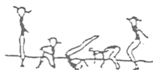
Rolanento à retaguarda (10%)